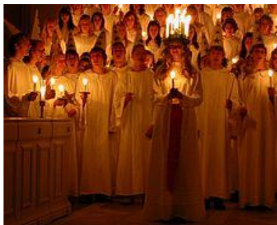
Pochód dziewczynek w dniu Św. Łucji

13 grudnia to w Szwecji święto światła obchodzone na pamiątkę Sw. Łucji z Syrakuz. Święta Łucja, która nie chcąc porzucić swojej wiary, pozbawiła się oczu, stała się patronką dnia uchodzącego za najkrótszy w roku. 13 grudnia wyznaczał też początek adwentu, w związku z którym jeszcze przed nastaniem świtu zasiadano po raz ostatni przed świętami Bożego Narodzenia za suto zastawionym stołem. "Święta Łucja" w rodzinie zostawała najstarsza córka, ubrana na białą, w wianku z zapalonymi świecami, budziła rodziców, śpiewając tradycyjną włoską piosenkę "Santa Lucia", podając kawę, czerwone grzane wino (glögg) i pszenne ciastka z rodzynkami i szafranem zwane lussekatter . Tego dnia odbywają się pochody dzieci w białych strojach, z przewodzącą orszakowi dziewczynką przybraną w wianek z płonącymi świecami.