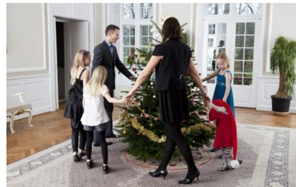
Taniec wokół choinki

Boże Narodzenie w Danii jest obchodzone podobnie jak w Polsce. W Wigilię cała rodzina spotyka się przy wieczornej wieczerzy i obdarowuje się prezentami. Duńczycy śpiewają bożonarodzeniowe pieśni tańcząc wokół choinki – symbolu życia. Wigilia to również jeden z nielicznych dni w Danii, kiedy większość ludzi udaje się do kościoła na mszę. Dni 25 i 26 grudnia są odpowiednio nazywane pierwszym i drugim dniem Świąt Bożego Narodzenia. W czasie świąt Bożego Narodzenia rodzina i znajomi urządzają świąteczne obiady julefrokost.