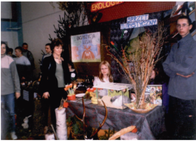
fot. Obchody Powiatowego Dnia Ziemi

II LO w Słupsku, III LO w Gdyni, następnie studiują w renomowanych uczelniach (m. in. Uniwersytety Medyczne: w Gdańsku, Bydgoszczy, Olsztynie, Uniwersytet Jagielloński w Krakowie, Politechnika Gdańska, Politechnika Koszalińska, Politechnika Warszawska), wśród nich mamy przyszłych inżynierów, lekarzy, prawników, nauczycieli i wielu wspaniałych fachowców.