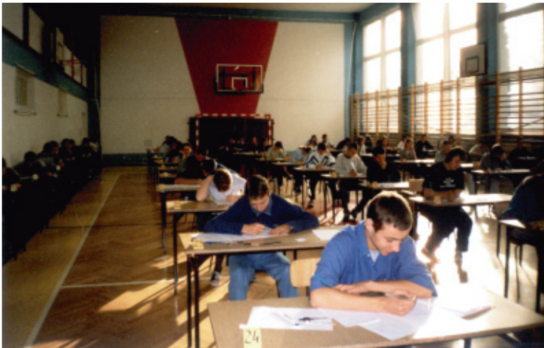
fot. Pierwszy egzamin gimnazjalny

II LO w Słupsku, III LO w Gdyni, następnie studiują w renomowanych uczelniach (m. in. Uniwersytety Medyczne: w Gdańsku, Bydgoszczy, Olsztynie, Uniwersytet Jagielloński w Krakowie, Politechnika Gdańska, Politechnika Koszalińska, Politechnika Warszawska), wśród nich mamy przyszłych inżynierów, lekarzy, prawników, nauczycieli i wielu wspaniałych fachowców.